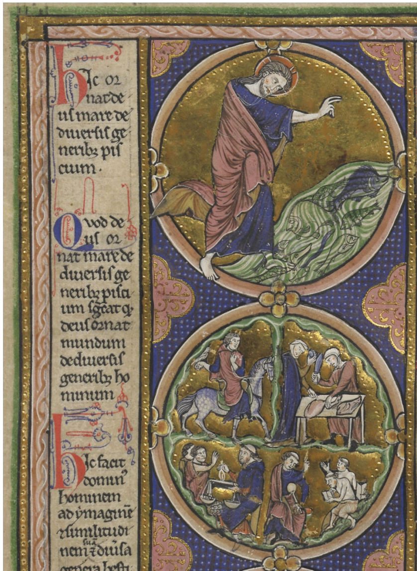
Ill. 7 – Gn 1, 21 : Vienne, ÖNB, Codex 1179, fol. 3v (A/a)