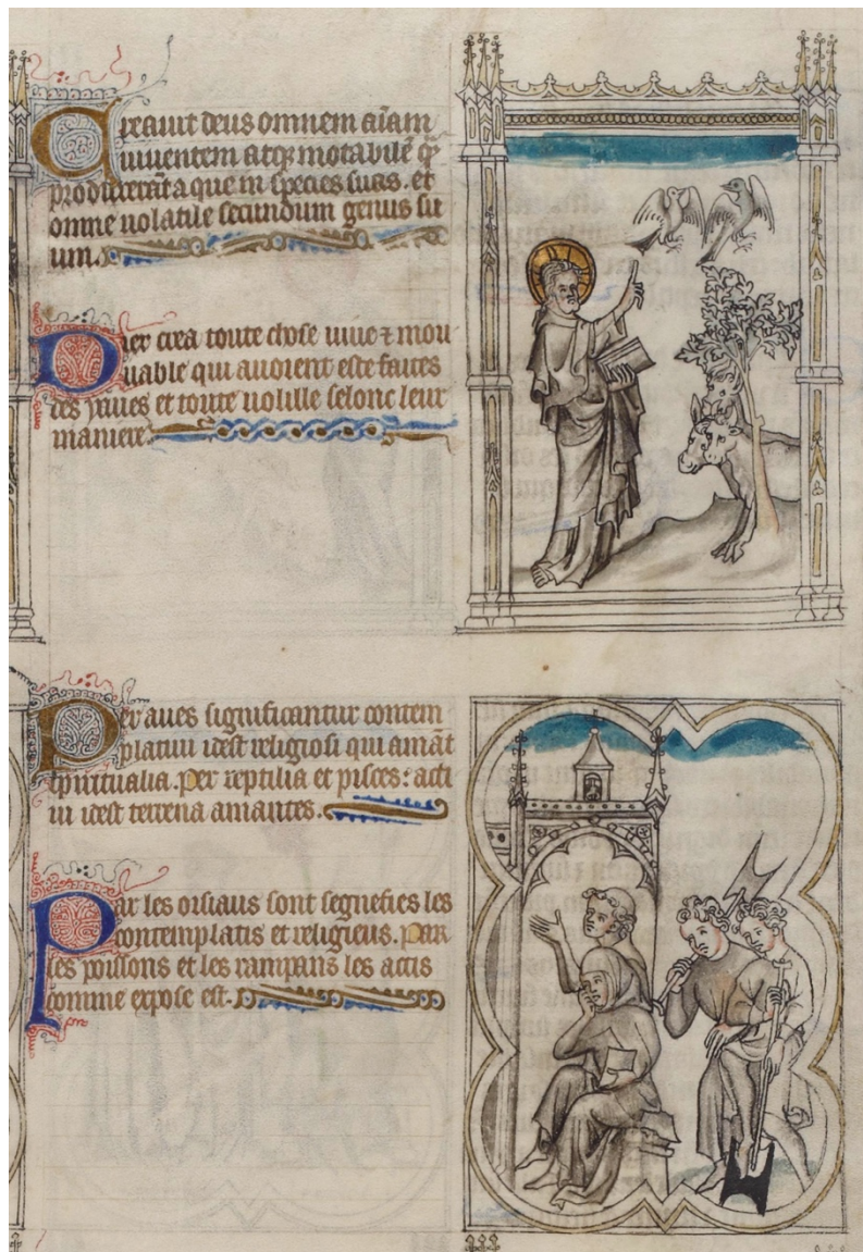
Ill. 5 – Gn 1, 21 : Paris, BnF, fr. 167, fol. 2 (C/c)