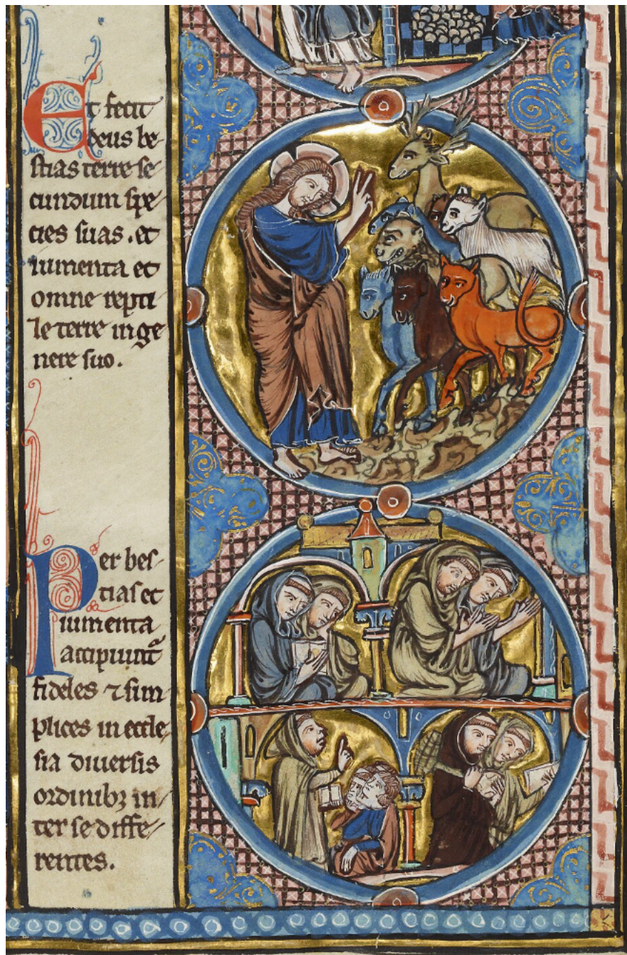
Ill. 11 – Gn 1, 25 : Oxford, Bodleian Library, MS Bodley 270b, fol. 4 (D/d)