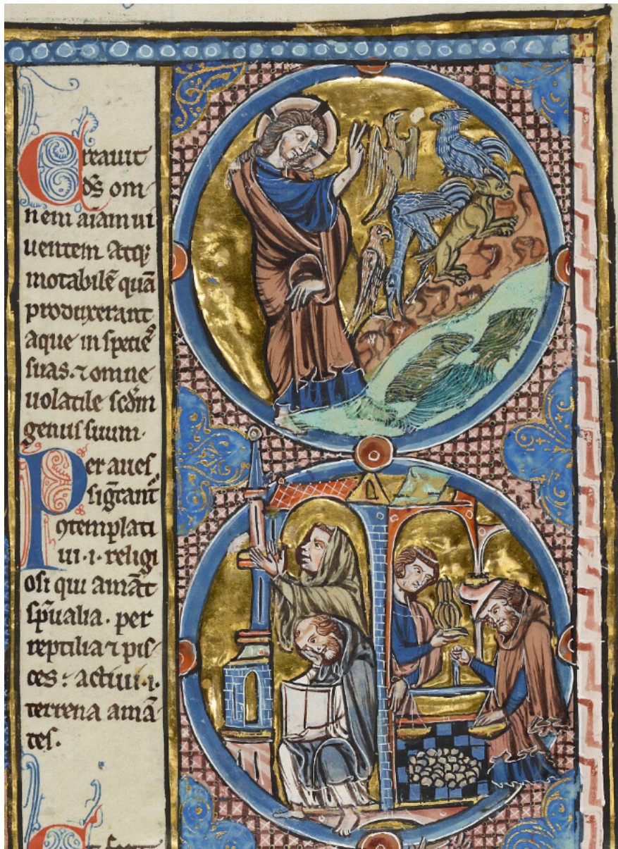
Ill. 4 – Gn 1, 21 : Oxford, Bodleian Library, MS Bodley 270b, fol. 4 (C/c)