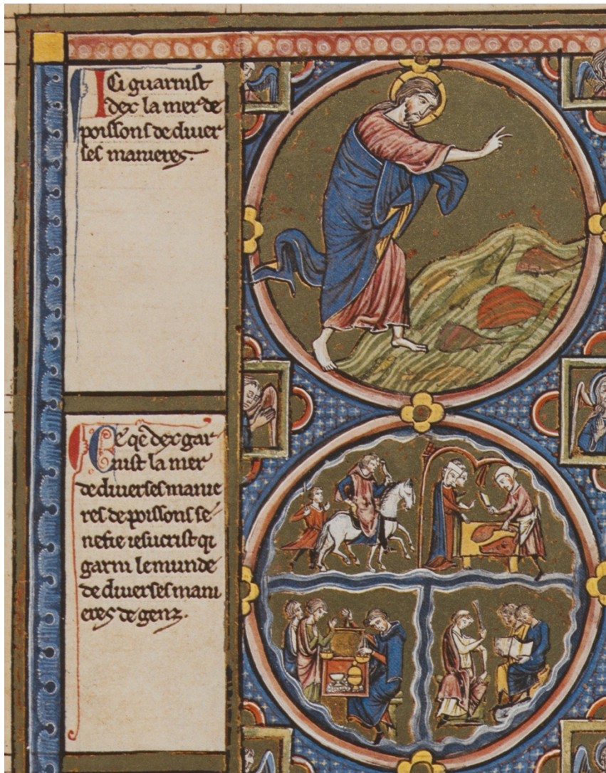
Ill. 6 – Gn 1, 21 : Vienne, ÖNB, Codex 2554, fol. 1v (A/a)