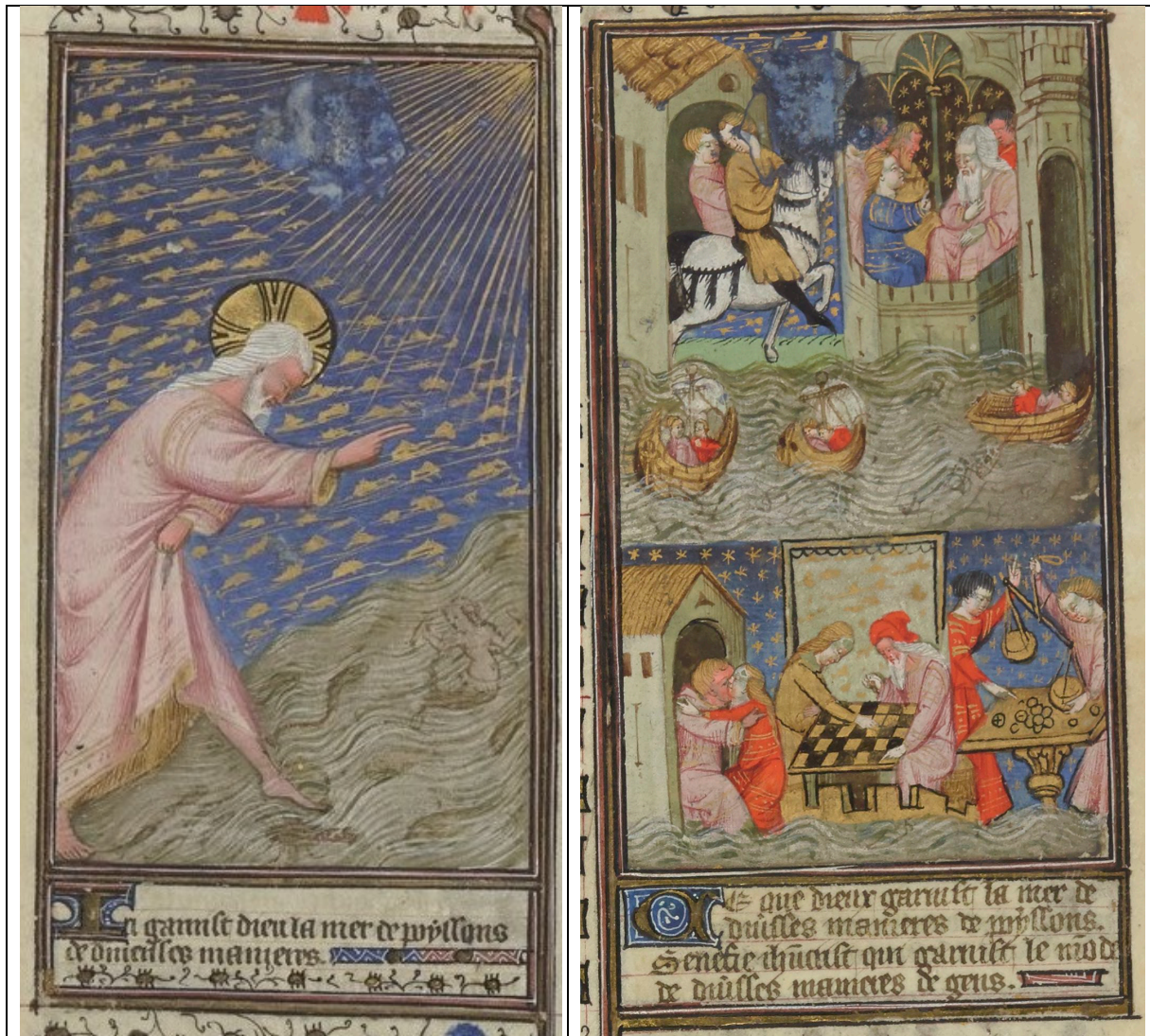
Ill. 9 – Gn 1, 21 : Paris, BnF, lat. 9471, fol. 5v-6