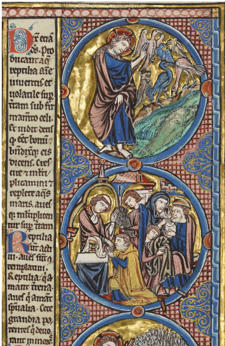
Ill. 2 – Gn 1, 20-22 : Oxford, Bodleian Library, MS Bodley 270b, fol. 3v (C/c)