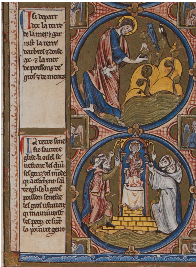
Ill. 1 – Gn 1, 20-22 : Vienne, ÖNB, Codex 2554, fol. 1 (C/c)