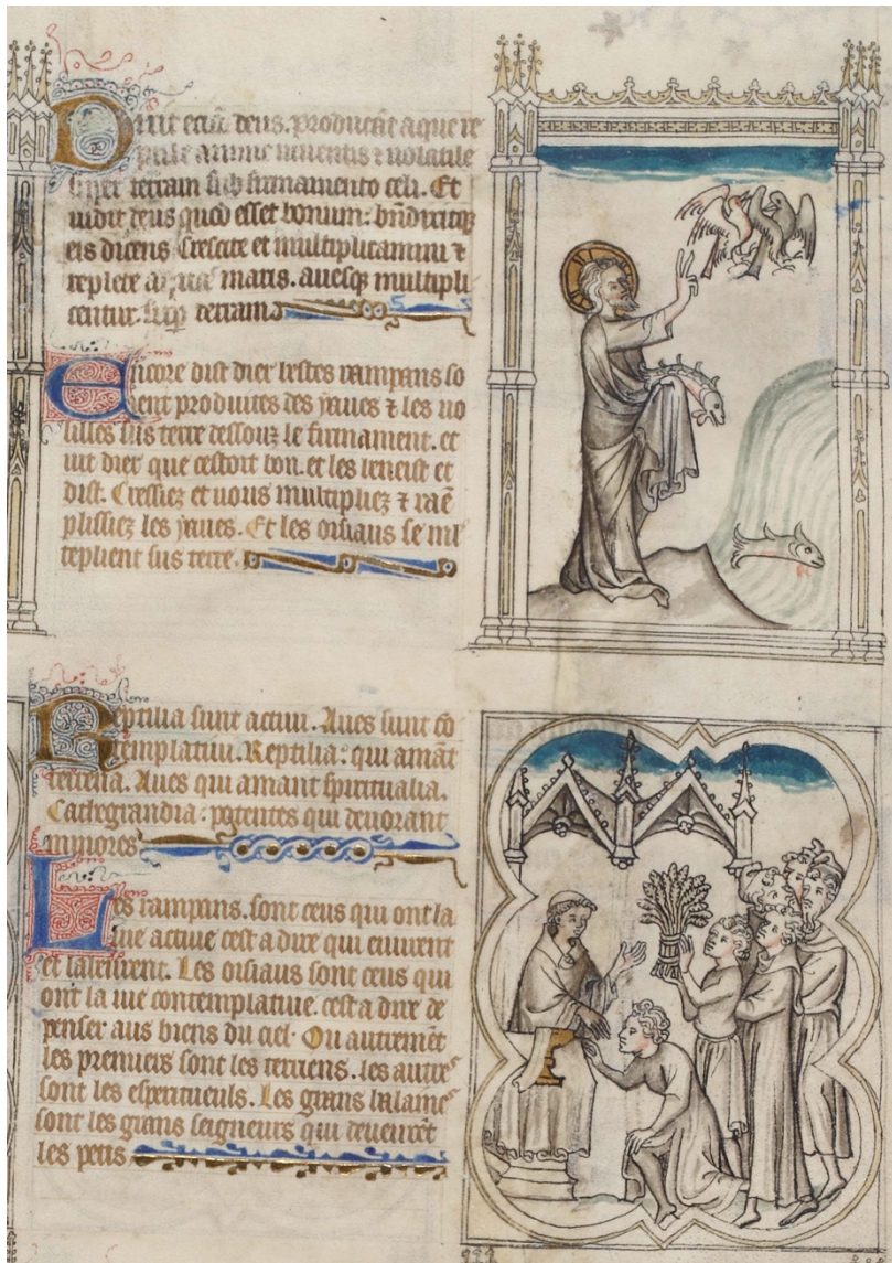
Ill. 3 – Gn 1, 20-22 : Paris, BnF, fr. 167, fol. 1v (C/c)