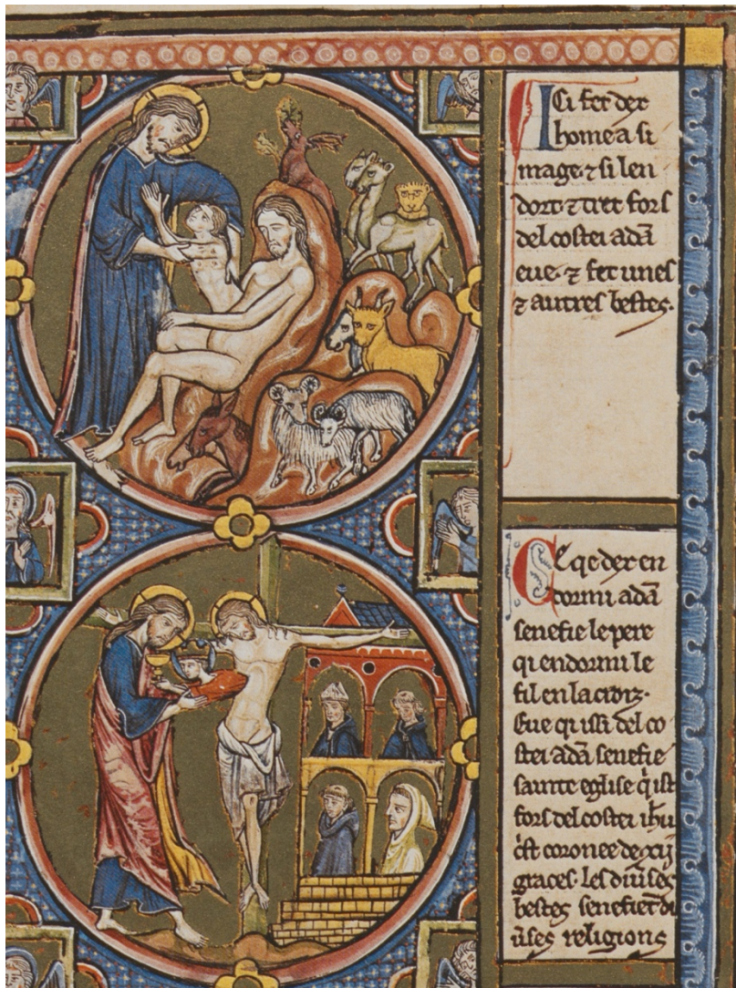
Ill. 10 – Gn 1, 25 : Vienne, ÖNB, Codex 2554, fol. 1v (B/b)