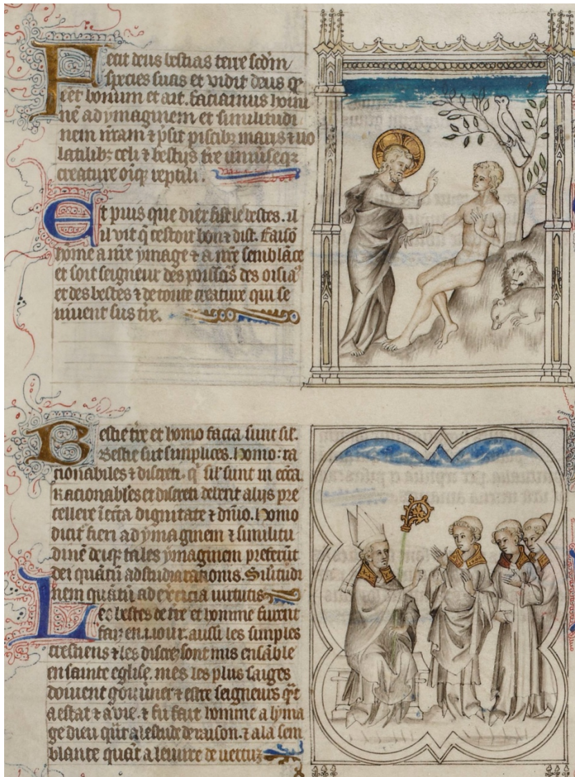
Ill. 13 – Gn 1, 25-26 : Paris, BnF, fr. 167, fol. 2v (A/a)