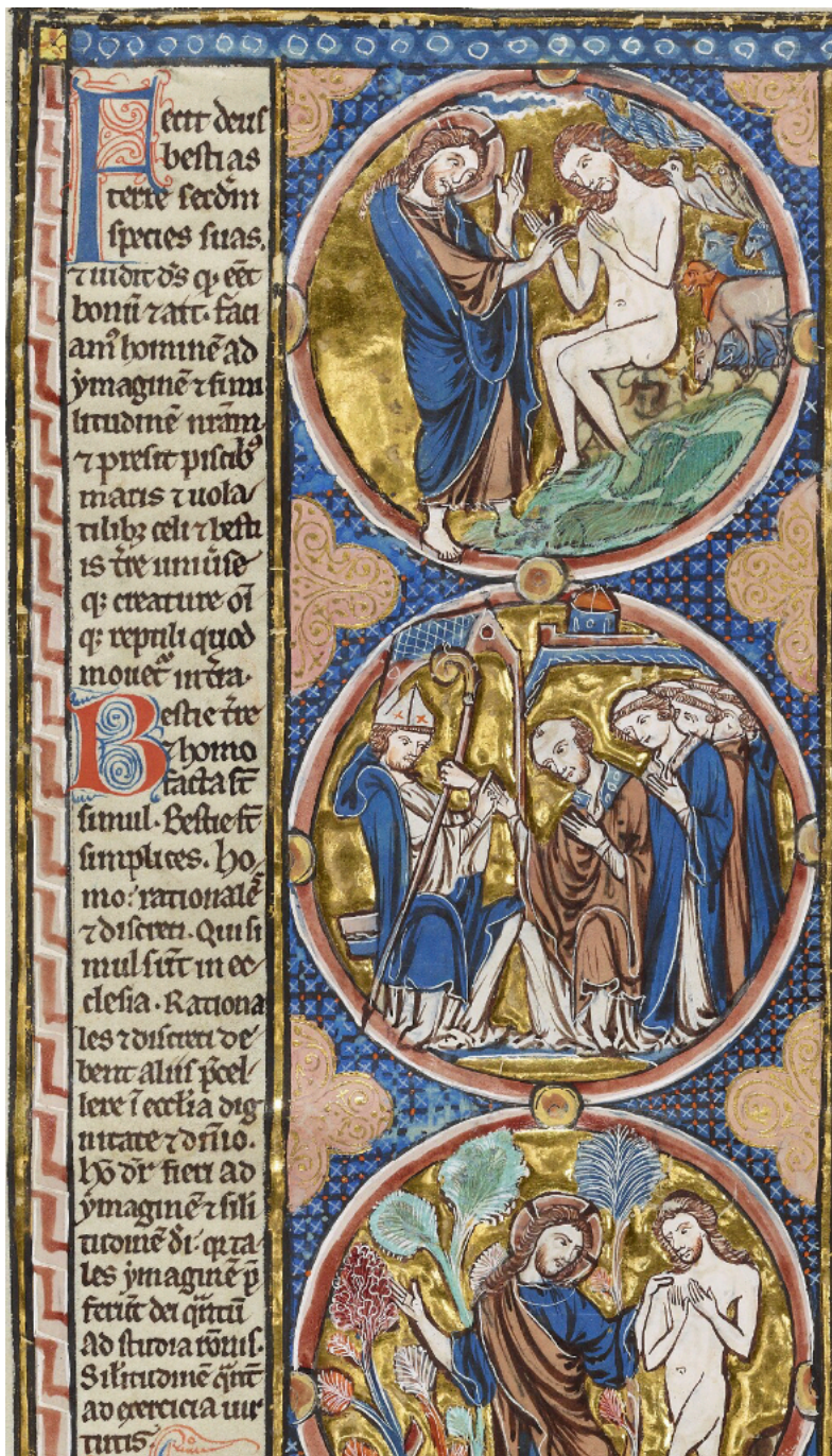
Ill. 12 – Gn 1, 25-26 : Oxford, Bodleian Library, MS Bodley 270b, fol. 5v (A/a)