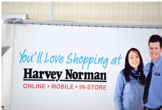
Figure 3.

Ceux-ci s'inscrivent tout à fait dans une logique d'optimisation de la pertinence au sens cognitif: la récompense promise est élevée (de nouvelles connaissances, une nouvelle perspective, une surprise, etc.) pour un effort minimal consistant à dérouler un contenu présenté sous forme de liste de photos ou de faits, facile et rapide à digérer entre deux tâches de bureau. Leur fonctionnement est alors proche de celui de la publicité, telle celle reproduite ci-dessous, qui promet une expérience émotionnellement satisfaisante aux clients de cette chaîne de magasins sans même lui dire ni ce qu'elle vend, ni où, ni à quel prix :