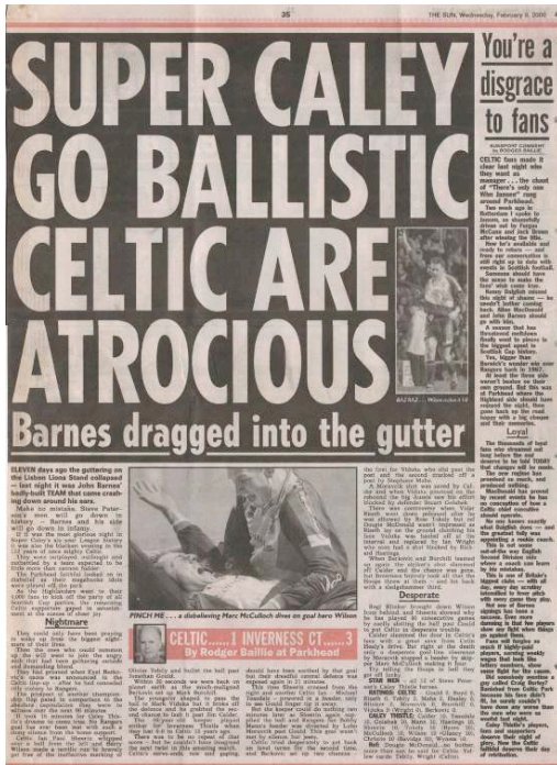
Figure 1. The Sun , 9 février 2000

comme Edward Sapir ou Otto Jespersen 7 . Dans son interprétation la plus élémentaire, sa syntaxe particulière, proche de celle des télégrammes et des dépêches ( block-language 8 ), est attribuée à un souci d'économie de caractères. Cependant, elle relève également d'une recherche d'expressivité visant à agir sur le destinataire, c'est-à-dire globalement à attirer l'attention du lecteur. Ainsi, comme dans de nombreux domaines de l'expressivité, l'anglais des headlines est au centre d'une tension entre créativité d'une part et normativité d'autre part. La première se manifeste notamment par le recours à une dimension pré-verbale du langage : typographie, sonorités, jeux de mots, voire musicalité :