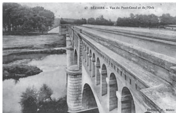
Carte postale ancienne du pont-canal de Béziers.

La chronologie de ce passage à Béziers ne laisse aucun doute sur les raisons qui ont conduit Pierre Tort à y venir, comme chaudronnier, avec sa famille. Le pont-canal de l'Orb, également appelé pont-canal de Béziers, fut en effet édifié précisément entre 1854 et 1856, en même temps que le port neuf de la ville et son écluse de haute chute, de plus de 6 m, sous la houlette de l'ingénieur Urbain Maguès (1807-1876). Celui-ci dirigeait depuis Toulouse ces travaux de réaménagement du canal du Midi, avec l'aide de son adjoint Simonneau, lui aussi ingénieur des Ponts-et-Chaussées, installé sur place à Béziers, ainsi que le