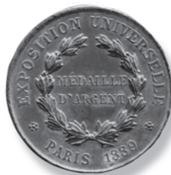
Médaille d'argent à l'exposition universelle de 1889.