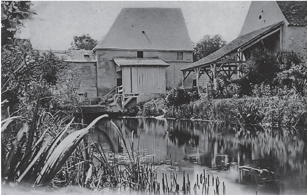
Carte postale ancienne du moulin de Luanges, à Urzy.