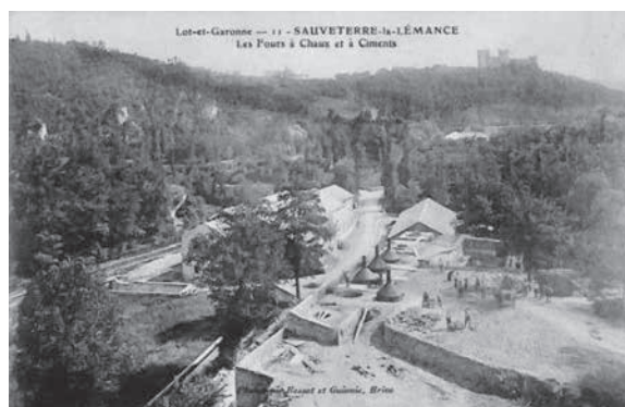
Carte postale ancienne des fours à chaux de Sauveterre-la-Lémance.