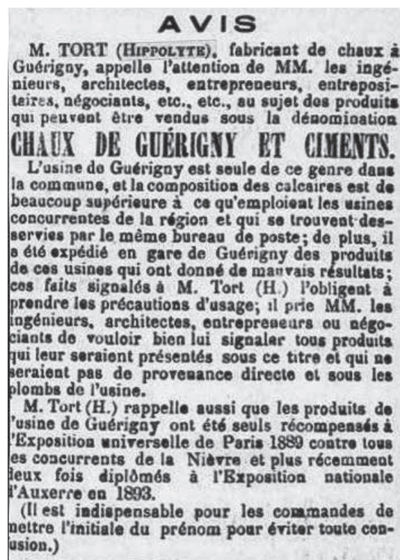
Encart paru dans le Journal du Cher du 23 juin 1894.