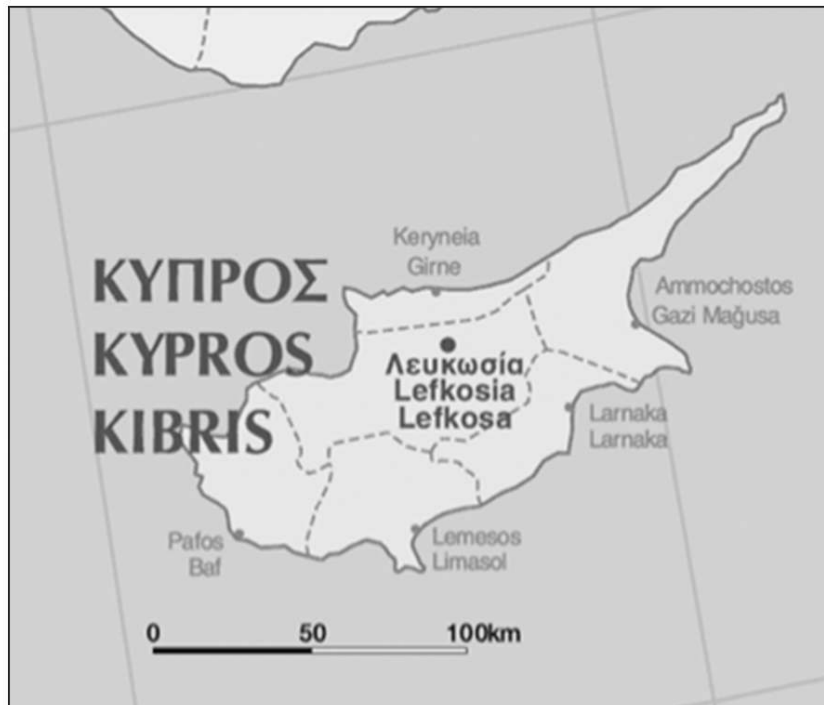
Figure 1 : Carte de Chypre selon l'Union européenne

l'objectif politique du Taksim, celui de la séparation des communautés. Dans la partie sud, les cartes routières et touristiques proposent aussi une carte générale de l'île de Chypre avec la frontière bien lisible. Par contre, la cartographie de l'île imposée par la République de Chypre (partie sud) lors des négociations pour l'entrée de Chypre dans l'Union européenne, représente celle d'une île unifiée.